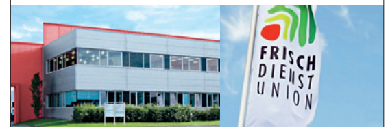
Firmengebäude der Zentrale in Versmold.

Die Frischdienst Union ist komplett eigenständig. Erweiterung um Qualitätsfleisch Plus (Natura Frisch). Start von HalbPension , das Sortiment für Frühstück- und Abendbrotverpflegung. Weitere frische conveniente Menüs werden am Markt eingeführt.